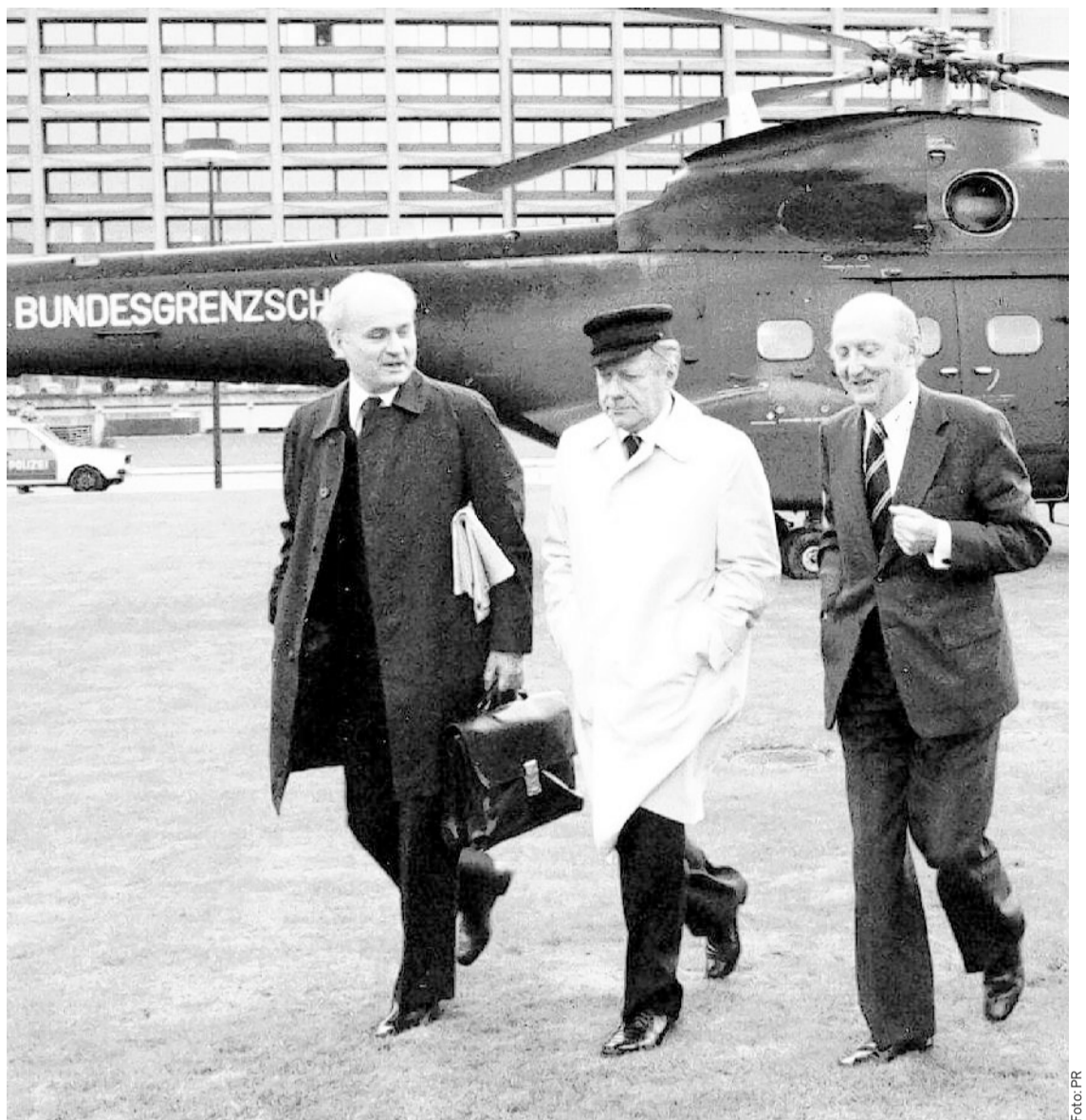
Bundesbankchef Otmar Emminger (rechts) holt Helmut Schmidt und Finanzminister Hans Matthöfer (links) ab.

Schmidt resümiert die strategischen Notwendigkeiten für das neue Währungssystem. Es dürfte nicht nur die längste, sondern auch die emotionalste Geheimrede sein, die ein Spitzenpolitiker je vor einem Notenbankgremium hält. Sein wichtigstes Anliegen: Angesichts der Dominanz der Deutschen in der europäischen Wirtschaft, aber auch lebendiger Erinnerungen an